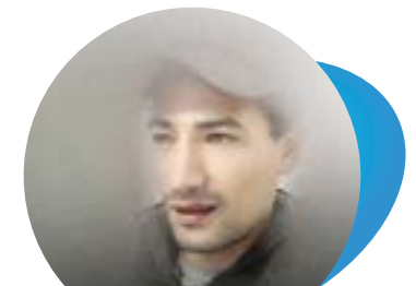
Habib Karboul Logistique & Sécurité